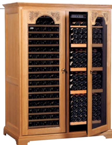
SKAPERTRANG: Det kan komme mye godt ut av et skap. Dette eksklusive vinskaper fra Dometic koster 144.000,- kroner.

AV ANDREAS KLEMSDAL ANDREAS.KLEMSDAL@FINANSAVISEN.NO